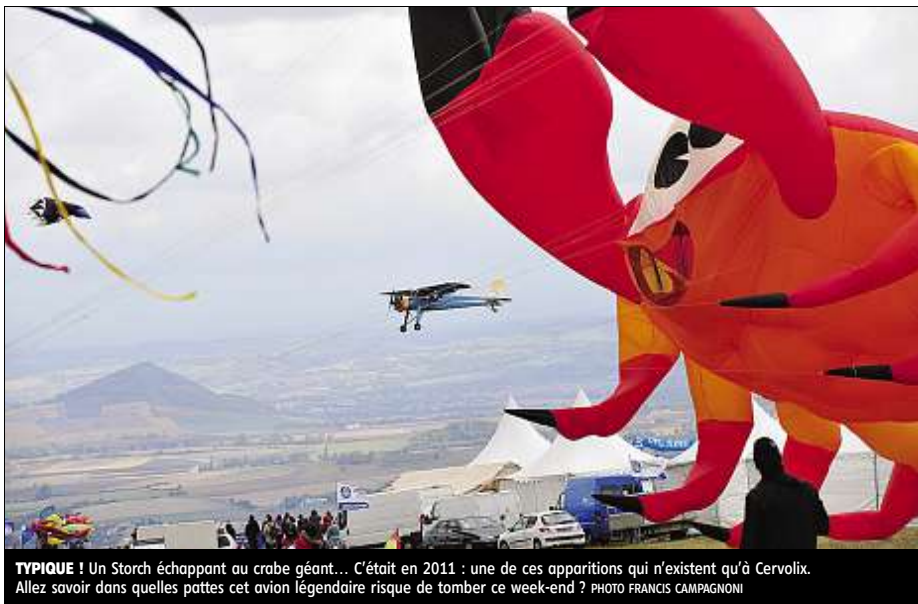
TYPIQUE ! Un Storch échappant au crabe géant... C'était en 2011 : une de ces apparitions qui n'existent qu'à Cervolix. Allez savoir dans quelles pattes cet avion légendaire risque de tomber ce week-end ?